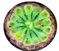
(戊) 牽牛花的莖 (己) 毛氈苔的葉子