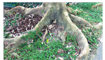
(庚) 馬鞍藤的莖 (丙) 鳳凰木的板根