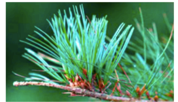
(甲) 榕樹的氣生根 (辛) 五葉松的針狀葉